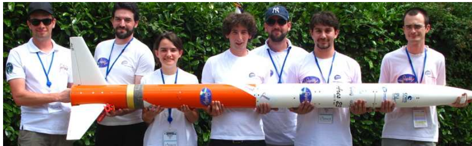
Ci-dessus : l'équipe ARES23 impliquée dans la campagne 2016 quelques instants avant le lancement de la fusée en matériaux composites.