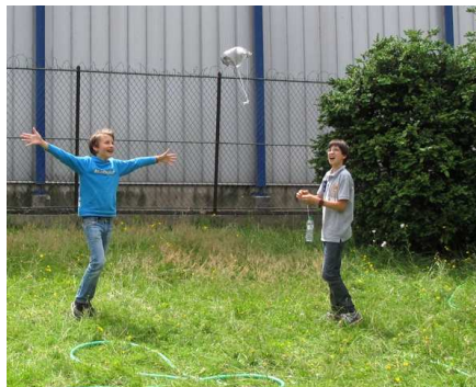
Ci-dessous : du test du parachute à son placement dans le corps de la micro fusée (à gauche et au centre). Programmation de la carte électronique depuis une interface informatique sous Arduino (à droite)

Les stages des vacances d'été ont à nouveau permis aux plus jeunes parisiens de s'initier soit à la construction de micro fusées, soit à la programmation par la réalisation de circuits électroniques sur une carte ordinateur. Un excellent moyen de lier l'électronique, l'informatique et les innombrables applications du quotidien mais surtout de mieux comprendre le fonctionnement des objets et technologies que nous utilisons chaque jour.