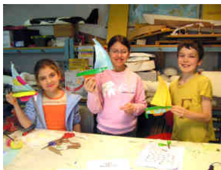
G07E002 - G07E010 - G07E029