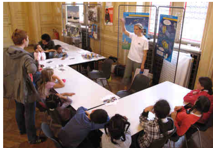
G10K016 - K011