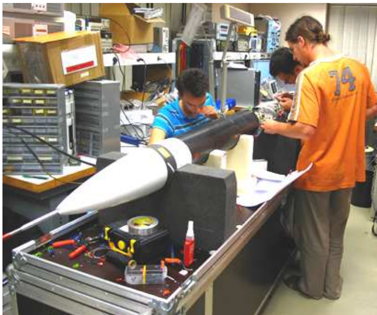
G11GIMG23339-2365-2430

Ci-dessus, à gauche : quelques réalisations du GAREF pour les expériences PERSEUS de cette année : Calculateur de bord (en haut) et diviseur de puissance hyperfréquence pour antennes patch de télémétrie bande S (en bas).