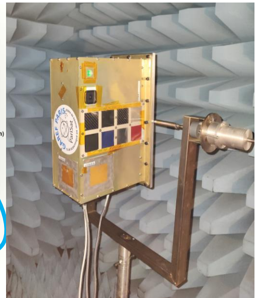
PariSat lors d'un essai de télémesure en chambre anéchoïque à l'ENSEA