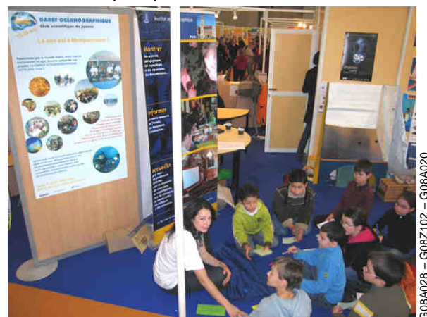
G08A028 - G08Z102 - G08A020