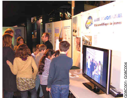
G08C001 - G08C004